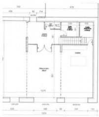
PLAN - REZ DE CHAUSSEE